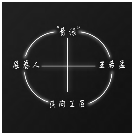
图1 《只此青绿》人物对话关系

内心,读懂了他的追求与梦想,看到了《千里江山图》背后的人与事,感受到了由“青绿”所象征的、逐渐形成的气与道,建立起了跨越悠悠千年的情感连接。这里以展卷人的视角,展示了文物研究工作者对并无落款的《千里江山图》的研究过程。前两幕《展卷》《问篆》展现了研究者们对画卷出处的研究:先是常规看落款处的印章及落款,无果,再阅读题跋,得到初步判断。后五幕《唱丝》《寻石》《习笔》《淬墨》《入画》展现的则是研究者对画卷作者及其创作过程进行深入研究,进一步肯定了“《千里江山图》是由王希孟所作”这一结论。