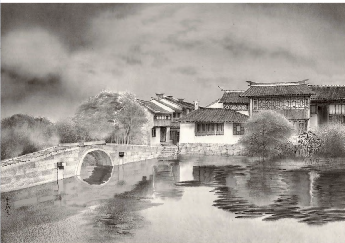
刘淑 《水墨江南系列之五》 纸本水墨 100cm×70cm 2021年

中国学术期刊GAP规范执行优秀期刊 中国学术期刊综合评价数据库来源期刊 《中国学术期刊(光盘版)》入编期刊 《中国期刊网》入网期刊 中文科技期刊数据库来源期刊 中国人文社科计量指标数据库来源期刊